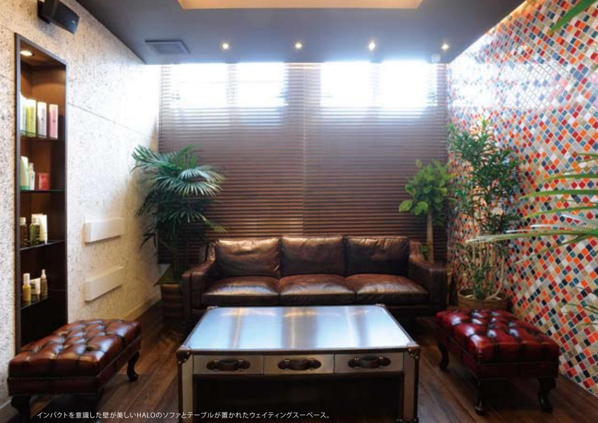
インパクトを意識した壁が美しいHALOのソファとテーブルが置かれたウェイトングスペース。