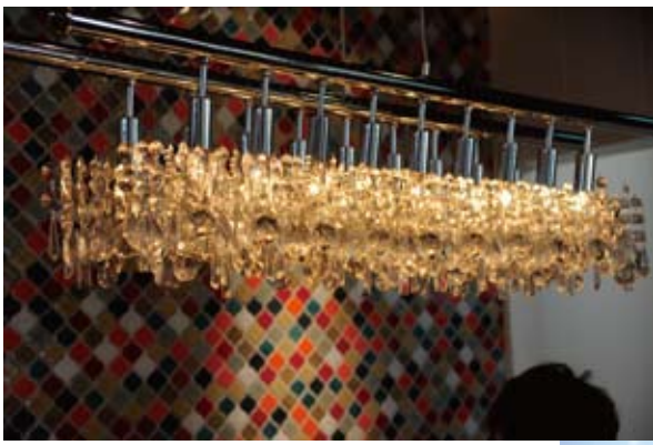
震災の影響で予定していたのが届かず、あちこち探して出会い、一目惚れで決まったシャンデリア。