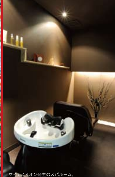
マイナスイオン発生のスパルーム。