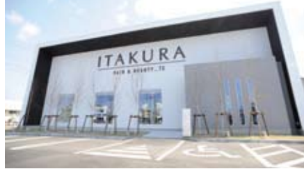
オープン前から注目されたインパクトのある外観。